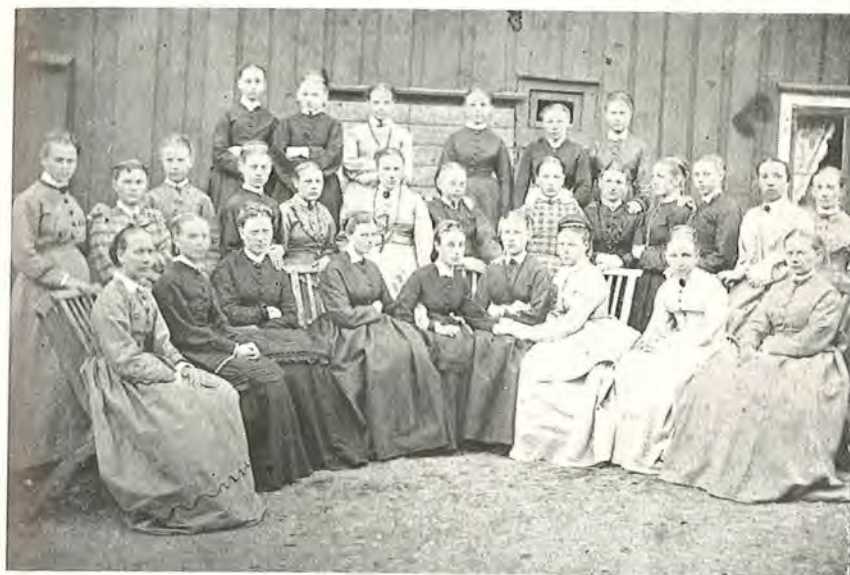
Grupp av elever