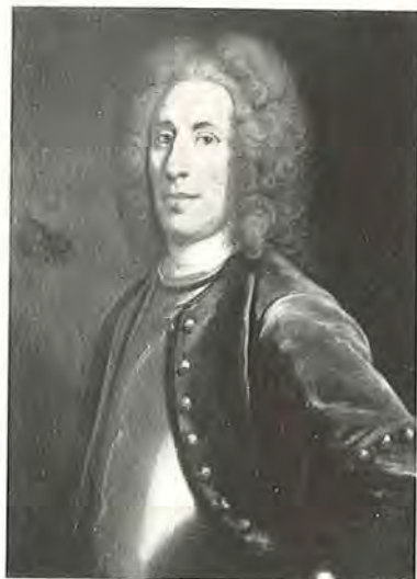
Foto efter porträtt å Boo slott av J. H. Scheffel

1668—1748 fältmarskalk grundare av folkskola i Bo