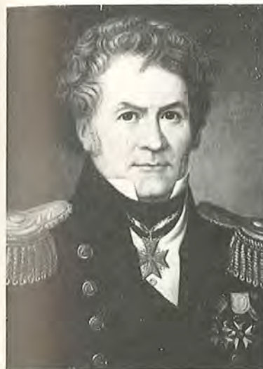
Carl af Forsell