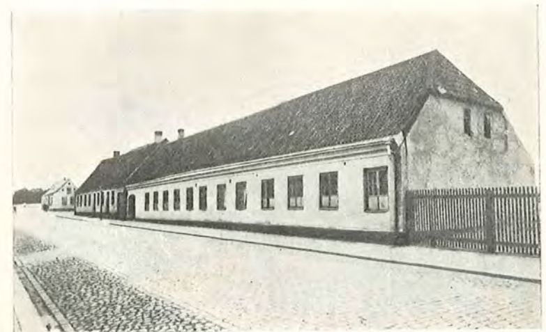
Seminarieriet 1843—1863 (Lankasterskolan vid Bredgatan).