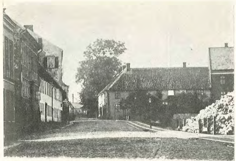
Härbärget, Seminarielokal 1839—1843.

Tisdag. ingenting af synnerlig vigt annat än att vi köpte sill. —