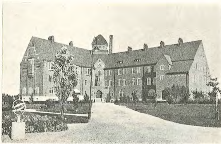
Det nuvarande seminariet.

Onsdag den 23. Sept. I dag börjas marknaden. Vi köpte 2 £6 bröd, äfven köpte vi i dag Hvardera en Dalklocka. Den var för mycket godt pris Nemlg. 6 Rdr. på marknaden var hela mårtens torg fullt med kreatur och Stora torg med Hästar. —