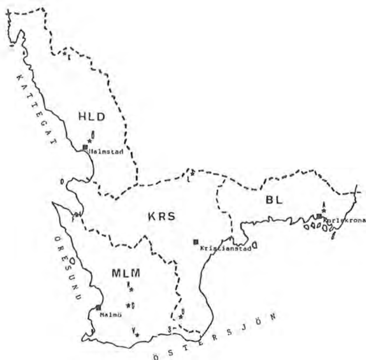
Figur 1. Tio socknar i sydvästra Götaland enligt systematiskt urval (=arkivområde för LLA, med år 1996 gällande länsgränser)

Socknarna (eller församlingarna) i det systematiska urvalet har fått sitt läge markerat på kartan, figur 1 (med begynnelsebokstaven i resp namn; A, F, G osv). Vidare är socknarna förtecknade i tabell 1 nedan.