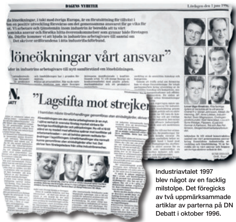
Industriavtalet 1997 blev något av en facklig milstolpe. Det föregicks av två uppmärksammade artiklar av parterna på DN Debatt i oktober 1996.

Som Seregards värdefullaste avtalsresultat har 1973 års trygghetsavtal betecknats, vilket lade grunden till Trygghetsrådet SAF-PTK. Det var en komplettering