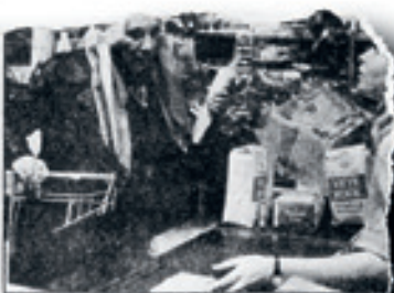
Journalisterna har varit i centrum för en rad olika konflikter och har varit en av de mest kritiserade organisationerna i Sverige.

Prinsipal Svenska Journalistförbundet har varit i centrum för en rad olika konflikter och har varit en av de mest kritiserade organisationerna i Sverige. Detta beror på dess starka koppling till den gamla journalistikens värdepapper och dess motstånd mot nya medier och tekniska förändringar.