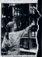
En person i skyddsutrustning vid en arbetsplats.

Vinerna har blivit ett av de mest kontroversiella ämnen i den svenska vinindustrin. Detta beror på olika typer av skyddsåtgärder som tagits för att skydda den inhemska vinindustrin.