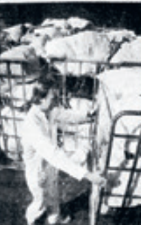
En person i skyddsutrustning vid en arbetsplats.

En stor del av de operationer som väntas nästa höst kommer att ske i samband med den pågående konflikten mellan journalisterna och deras arbetsgivare. Detta innebär att många journalister kommer att vara inblandade i olika typer av demonstrationer och motstånd.