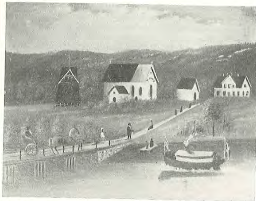
Själevads gamla kyrka och första folkskolebyggnad samt dess första propellerbåt byggd på Göranssons båtvarv beläget strax till vänster om den nya bron över Prästsundet.

Skolstyrelsen och sockenmännen måste också utreda och fatta beslut om skolmästarens löneförmåner och anställning vid den ny-