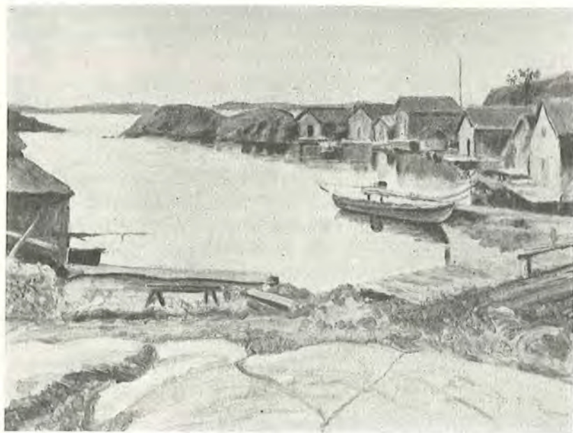
Grisslans fiskeläge. Oljemålning av Edv. Hesselgren.

Ett år en dag på våren skulle kyrkokören uppvakta och sjunga för en aktningsvärd församlingsbo, som fyllde femtio år. Men det måste ske tidigt på morgonen, ty de flesta sångarna måste finnas i