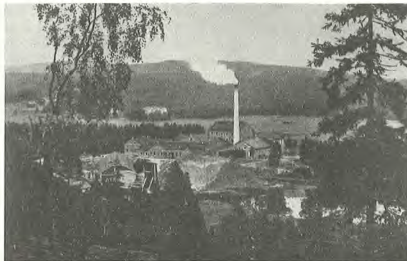
Domsjö sulfittfabrik med Hörnetts folkskola i skogsbrynet.